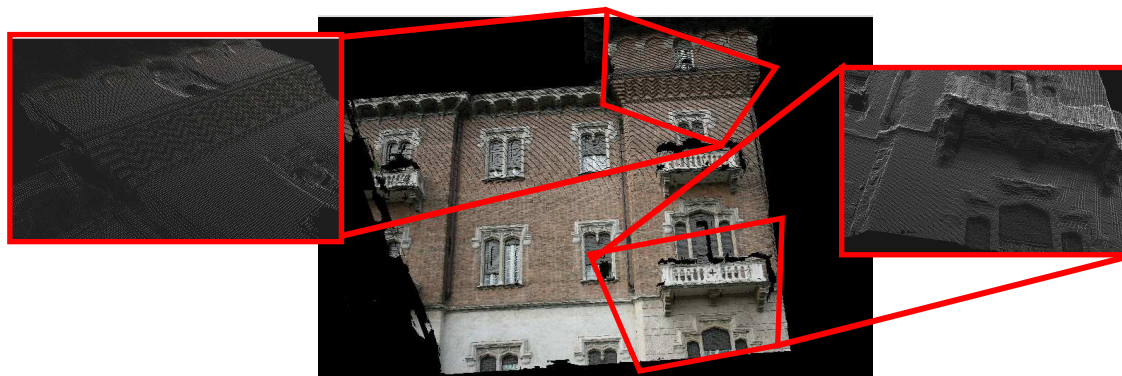
Figura 1 – Nuvola di punti ottenuta su una delle facciate prese in esame con il sistema Z-Scan

In ogni prova le precisioni geometriche sono state valutate confrontando i modelli 3D generati con quelli ottenuti da strumenti laser scanner ( Riegl LMS-Z420 ) di precisione nota ( \sigma = \pm 5 mm). Come esempio, sono riportate nella tabella a fianco i risultati ottenuti nella prova eseguita sull'edificio raffigurato in figura 1.